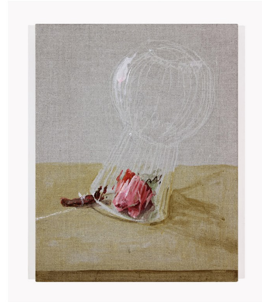
Fly Trap 003 2021 Pigmenti, acrilico su lino Pigments, acrylic on linen canvas 29x23 Cm