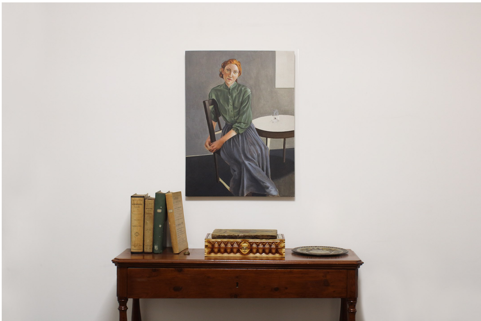
La Trappola del tempo | Curated by Angela Madesani | Sudio Legale De Capoa (Hungarian Consulate) | Bologna | Until 20 January 2024