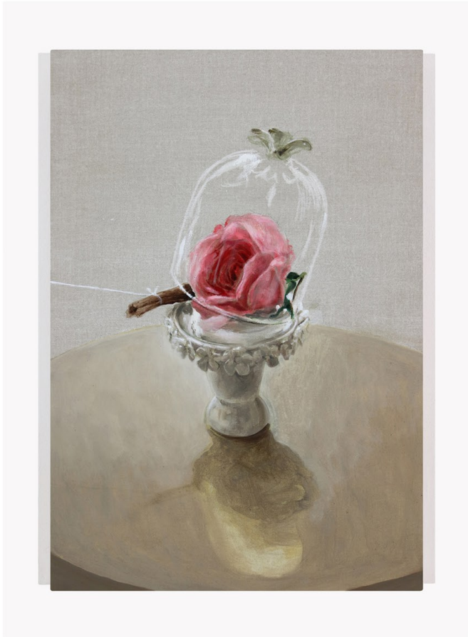
Fly Traps 019 2021 Pigmenti, acrilico su lino Pigments, acrylic on linen canvas 50x35 Cm