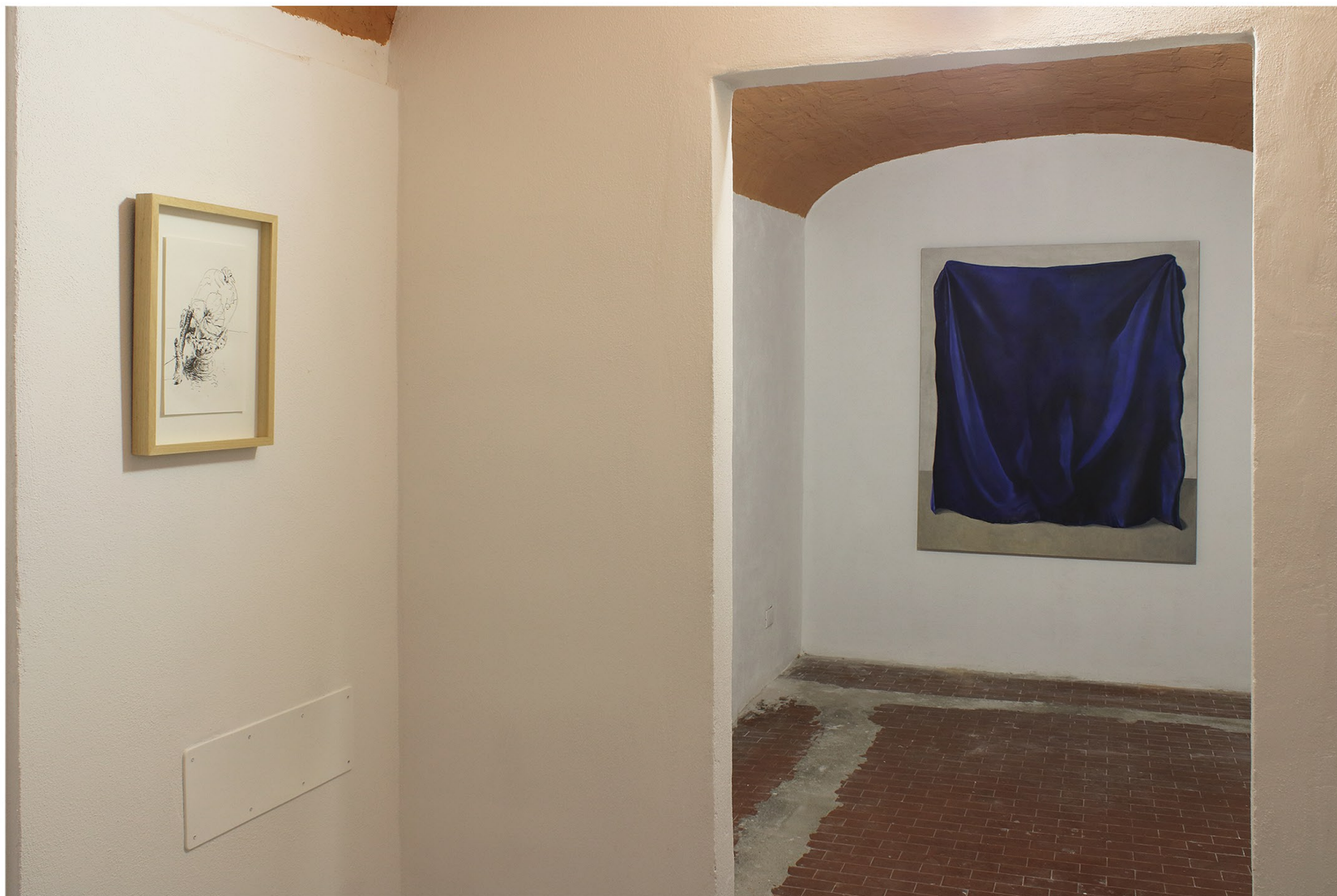
La Trappola del tempo | Curated by Angela Madesani | Sudio Legale De Capoa (Hungarian Consulate) | Bologna | Until 20 January 2024