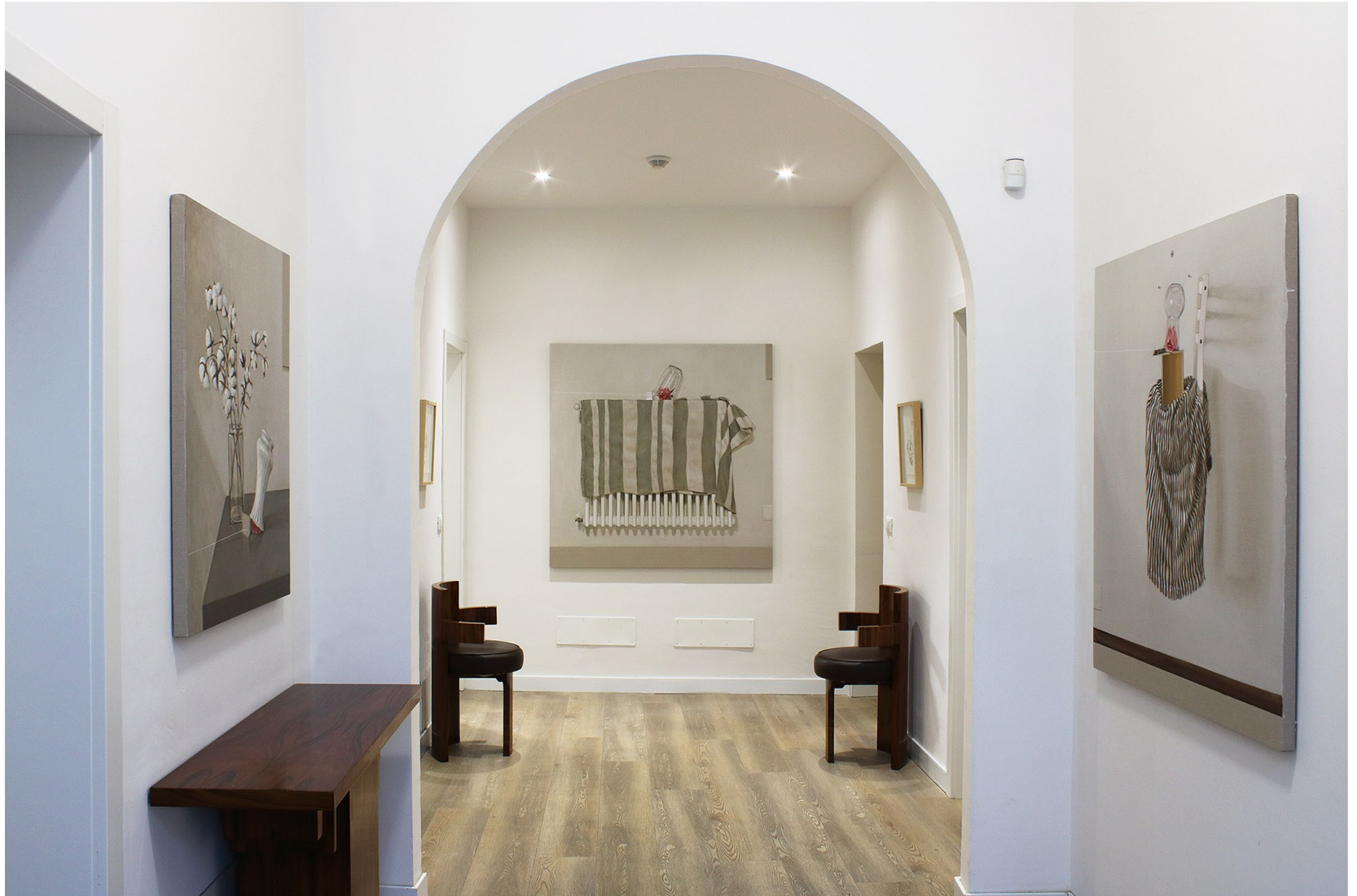
La Trappola del tempo | Curated by Angela Madesani | Sudio Legale De Capoa (Hungarian Consulate) | Bologna | Until 20 January 2024