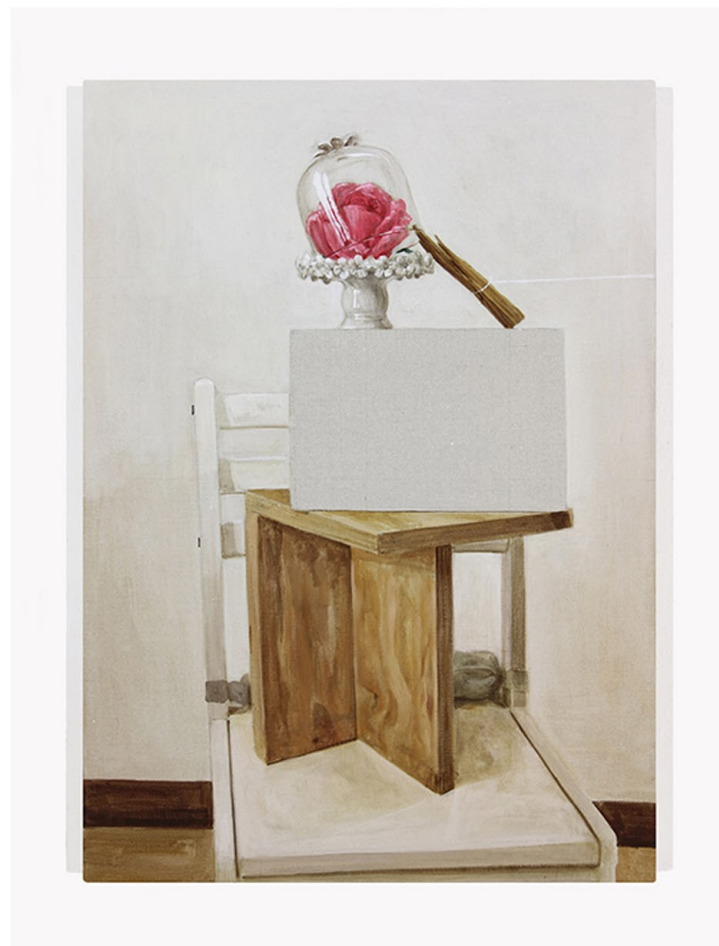
Fly Traps 043