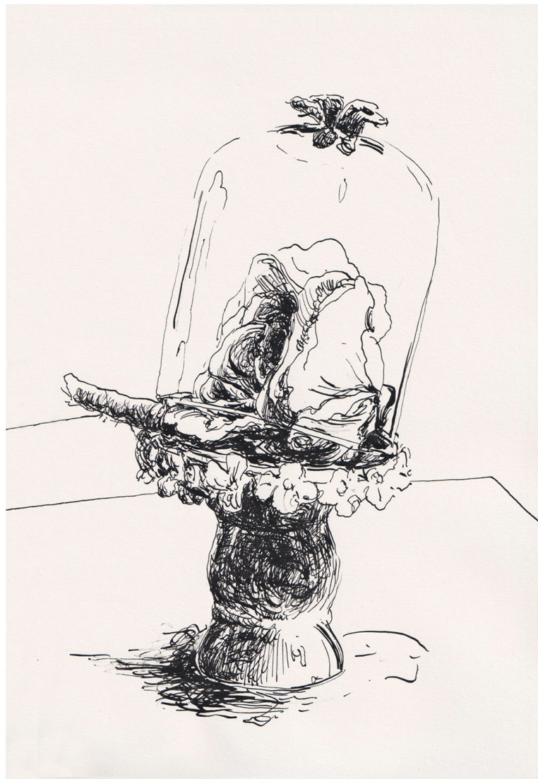
Fly Traps 032 2021 Inchiostro su carta Ink on paper 30x20 Cm