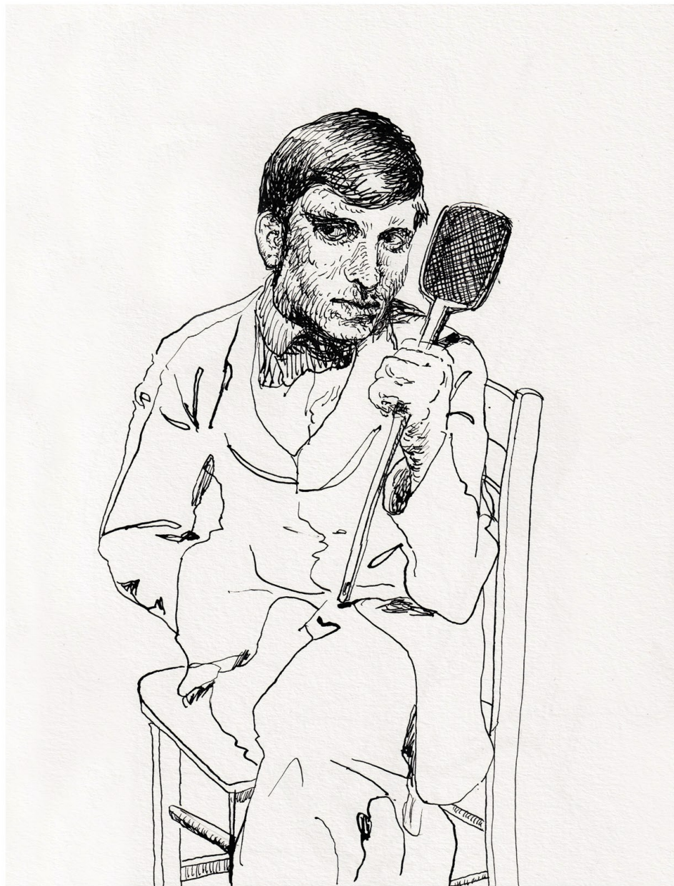
Hunter 010 2024 Inchiostro su carta Ink on paper 30x22 Cm