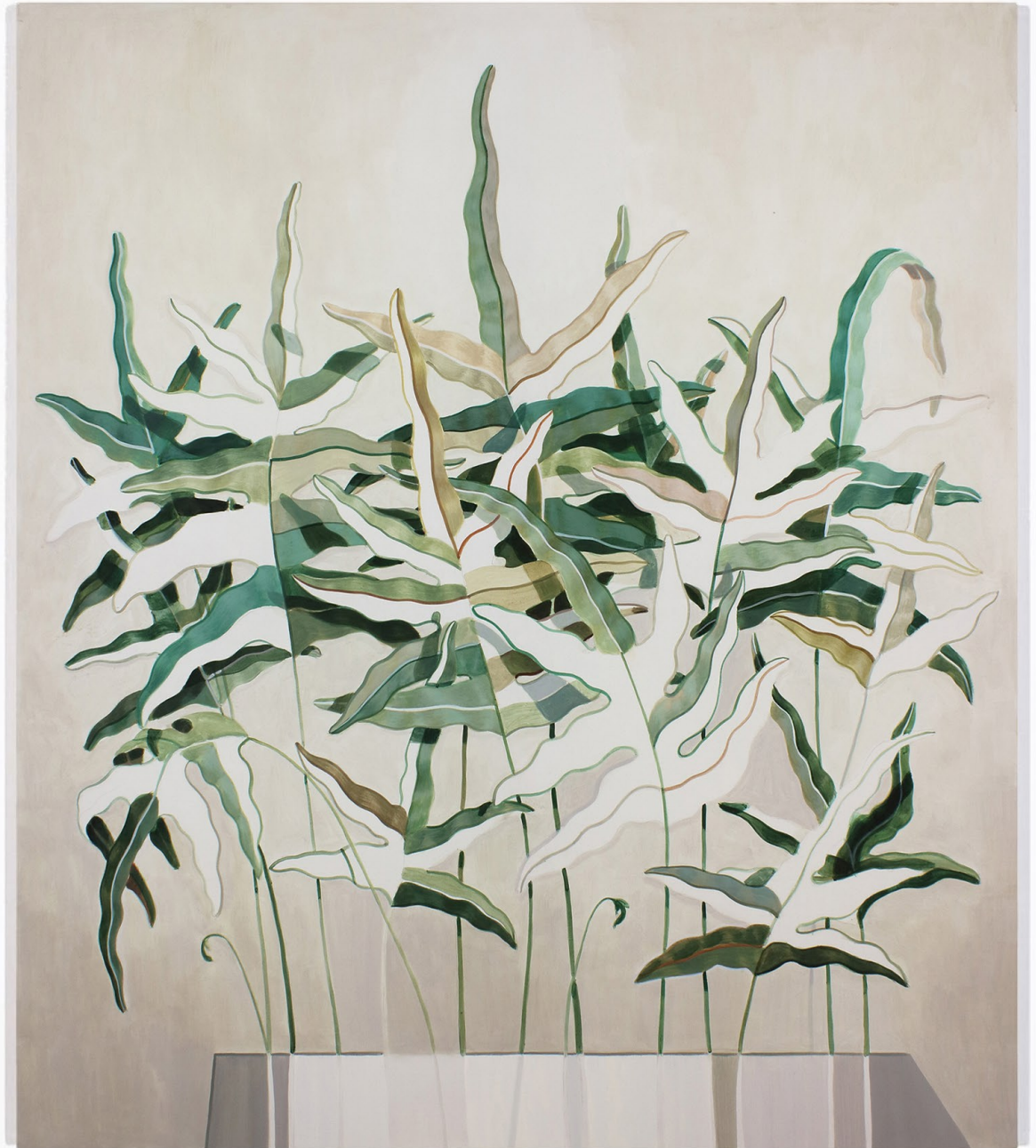
Ferns 097 2021 Pigmenti, acrilico su lino Pigments, acrylic on linen 160x140 Cm