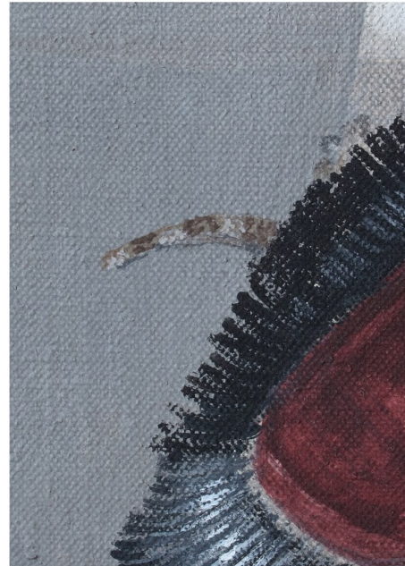
Hunter 007 (detail) 2023 Pigmenti, acrilico su lino Pigments, acrylic on linen 150x130 Cm