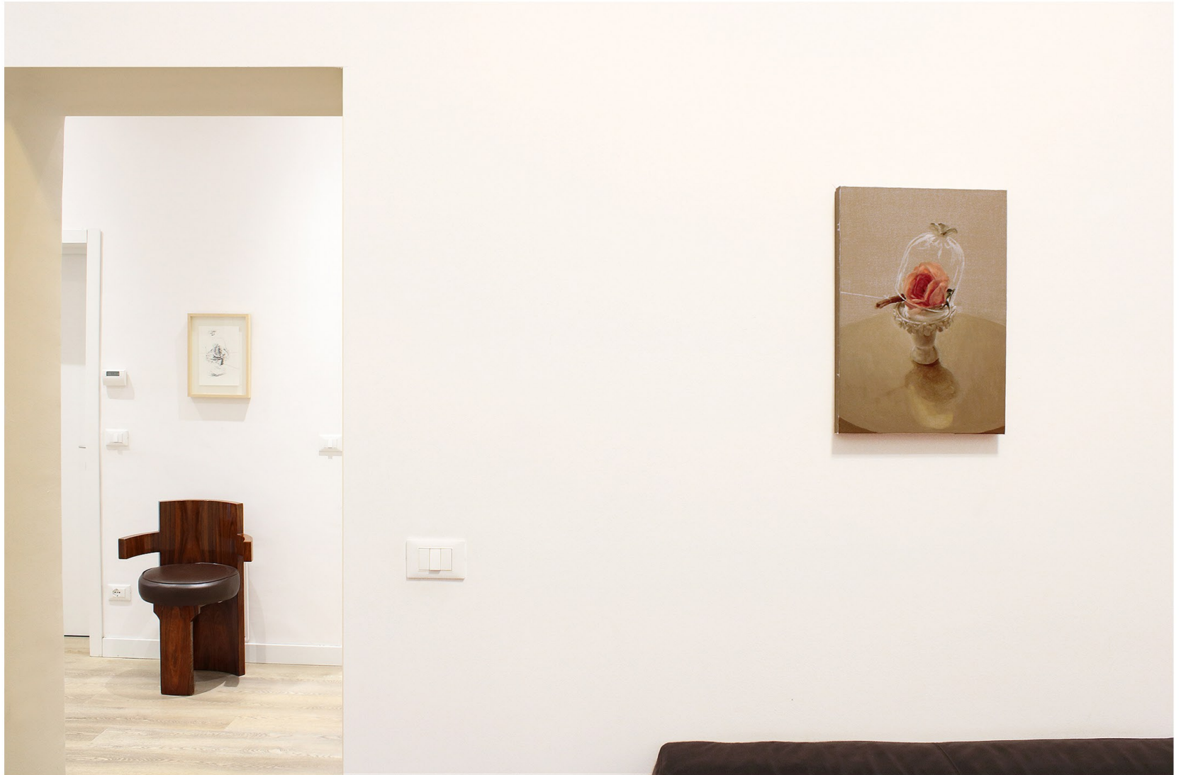
La Trappola del tempo | Curated by Angela Madesani | Sudio Legale De Capoa (Hungarian Consulate) | Bologna | Until 20 January 2024