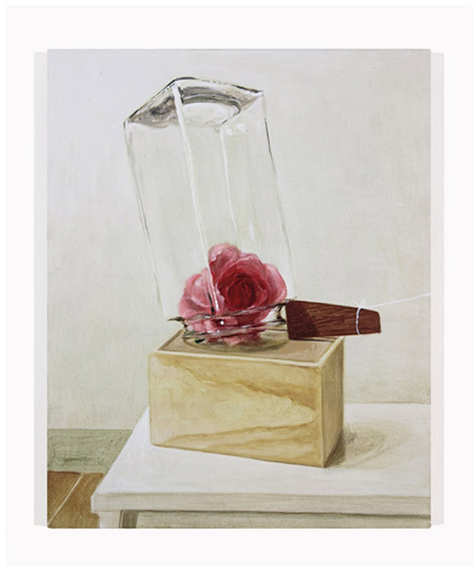
Fly Traps 039